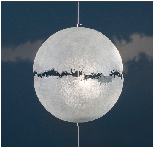
VERSION HALOGÈNE PRÉCÉDENTE

Dans le nouveau Catalogue 'Selezione 2018', nous avons présenté les lampes PostKrisi F 64 et PostKrisi T 61 avec des sources d' éclairage à LED, qui répondent aux demandes d'économies d'énergie. Nous tenons à souligner que cet 'upgrade' implique un effet d'éclairage diffus, qui, par rapport à la version halogène précédente, est plus doux et donc il projette un jeu d'ombre/lumière plus délicat. Les images incluses dans le Catalogue aux pages 96 et 97 sont donc remplacées par les photos déjà publiées sur notre site Web www.catellanismith.com , où vous pouvez voir aussi les lumières allumées.